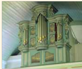
Arp Schnitger-Orgel, Grasberg

Der große Orgelbaumeister Arp Schnitger hat nicht nur den Orgelbau der ihm nachfolgenden Generationen, sondern auch Komponisten und Organisten geprägt. Diese Entwicklung ist auf der Orgelreise „Schnitgers Erben“ zu erleben. Zunächst wird die Schnitger-Orgel (1693/94) in Grasberg vorgestellt. Einer der letzten Vertreter dieser Schule ist Georg Wilhelm Wil-