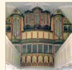
Gloger-Organ, Neuhaus (Oste)

Kostenbeitrag pro Person: 59,- € Mitglieder der Orgelakademie Stade e. V.: 53,- € Im Preis enthalten: Konzert, Orgelvorgstellungen, Busfahrten, Schifffahrt, Kartoffelsalat und Würstchen. Getränke sind vor Ort selbst zu bezahlen!