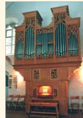
Hillebrand-Organ, St. Andreas, Verden