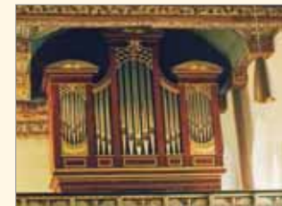
Christoph Donath Organ, Neuenkirchen

Ein weites Spektrum der Orgelbaukunst kann bei einer Tagesexkursion ab Verden erlebt werden. Zwei neuere Instrumente in Verden (St. Andreas; Hillebrand-Organ, 1974) und Bremen (Rembertikirche; Fischer&Krämer-Organ, 1991) mit ihren vielfältigen klanglichen Möglichkeiten umrahmen den Tag. Nach einem gemeinsamen Mittagessen in Verden führt die Reise nach Bremen, wo die seltene Möglichkeit besteht, eine große romantische Konzertorgel näher kennenzulernen, nämlich die im Jahr 1928 erbaute Orgel der Werkstatt Wilhelm Sauer im großen Saal des Bremer Konzerthauses „Glocke“. Anschließend führt die Reise weiter zu der wunderschönen dreischiffigen gotischen Hallenkirche St. Cyprianus und Cornelius in Ganderkesee, wo Arp Schnitger im Jahre 1699 eine zwei-