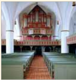
Arp Schnitger-Organ, Ganderkesee

Kostenbeitrag pro Person: 49,- € Mitglieder der Orgelakademie Stade e. V.: 44,- € Im Preis enthalten: Orgelvorgstellungen, Mittagbuffet, Kaffeetafel, Busfahrten. Getränke beim Mittagessen sind vor Ort selbst zu bezahlen!