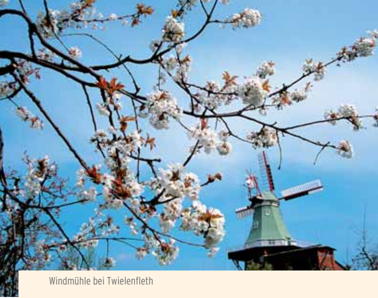
Windmühle bei Twielenfleth