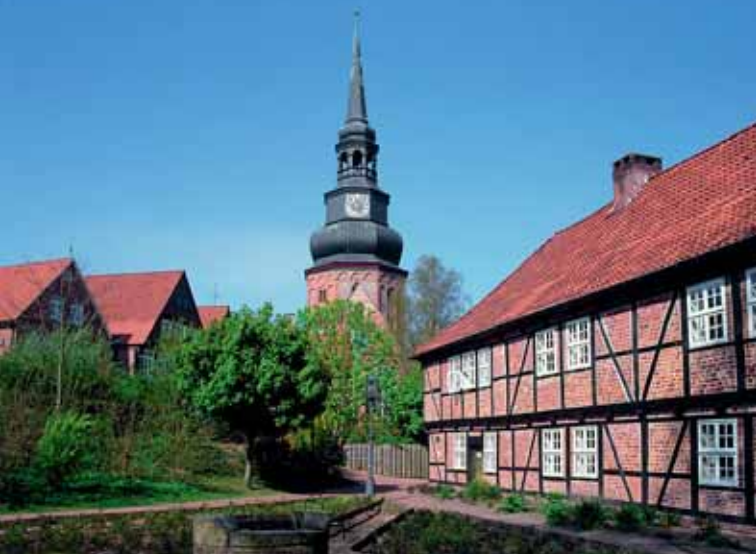
St. Cosmae und Johanniskloster