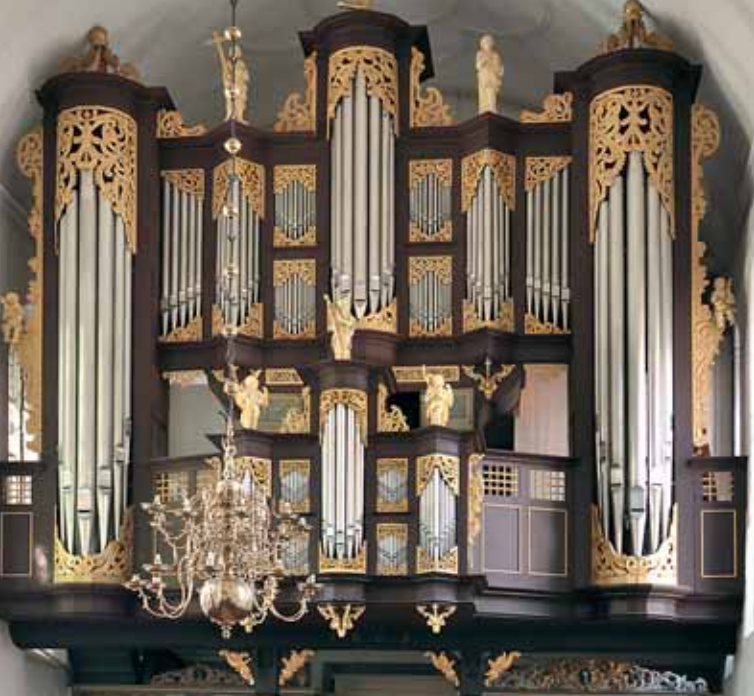
Huß-Schnitger-Orgel St. Cosmae Stade

St. Cosmae-Kirche, Stade - Huß/Schnitger-Orgel (1675) St. Wilhadi-Kirche, Stade - Erasmus-Bielfeldt-Orgel (1736)