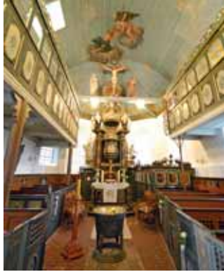
Borstel (oben), Neuenfelde