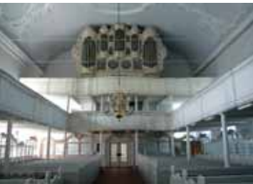
Oederquart (oben), Osten