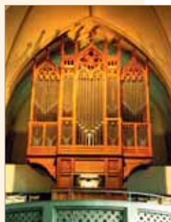
Klais-Orgel Rotenburger Stadtkirche