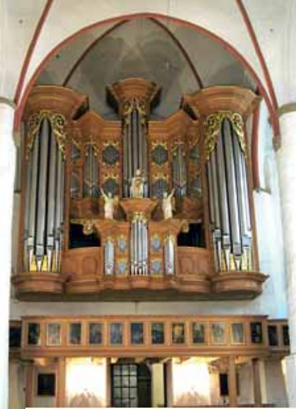
St. Jacobi-Kirche Hamburg