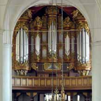
St. Wilhadi Stade