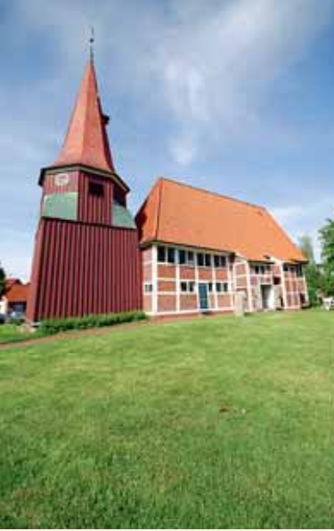
Grünendeich (Kirche und Schiff)