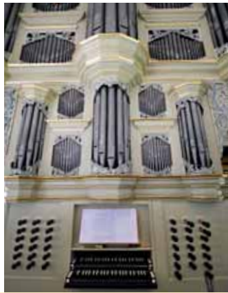
Stade (oben), Mittelkirchen