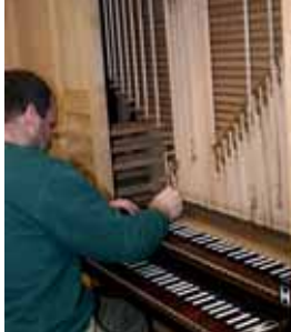
In der Orgelbauwerkstatt Ahrend, Leer