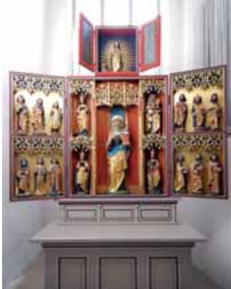
Gertruden-Altar St. Cosmae